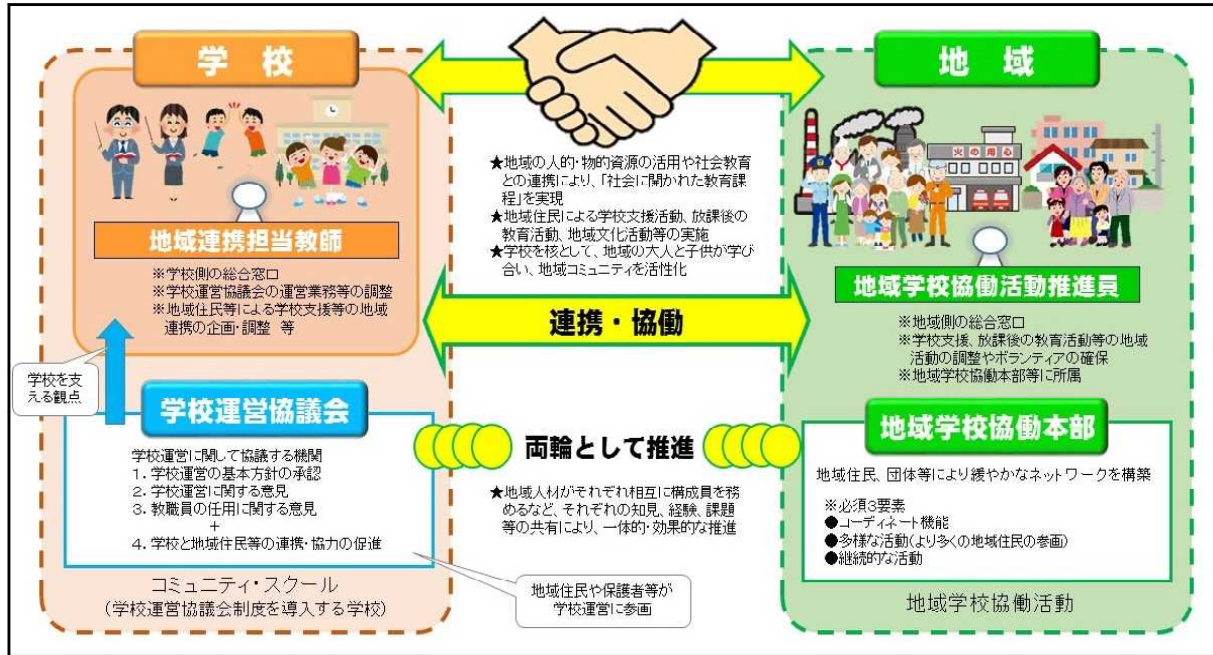
＜学校運営協議会と地域学校協働本部の推進体制＞

学校運営協議会の仕組みを生かして学校と地域の効果的な連携・協働を推進していくためには、より多くのより幅広い層の地域住民、団体等が参画し、緩やかなネットワークを形成する「地域学校協働本部」と双方が機能することが重要です。地域学校協働活動推進員が学校運営協議会の委員になることで、学校と地域が目標やビジョンをしっかりと共有した上で、効果的に地域学校協働活動を実施することが可能になるとともに、学校と地域が「一体的」に取り組む推進体制を構築することができます。