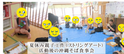
夏休み親子工作(ストリングアート) 活動後の沖縄そば食事会

支援内容 居場所提供、学習、体験活動、キャリア教育、登校支援、送迎支援、訪問支援等