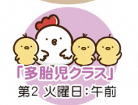
「多胎児クラス」 第2 火曜日:午前