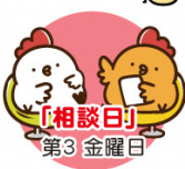
「相談日」 第3 金曜日