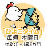
「ひよこタイム」 毎週 木曜日 対象:0～1歳6か月