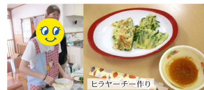
ヒラヤーチー作り

※利用は無料です。利用するにあたっては、こども未来課こども支援サポーターにご相談ください。