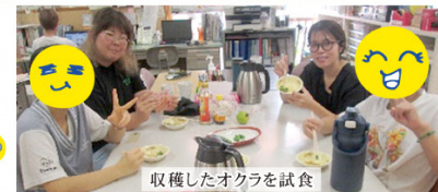
収穫したオクラを試食