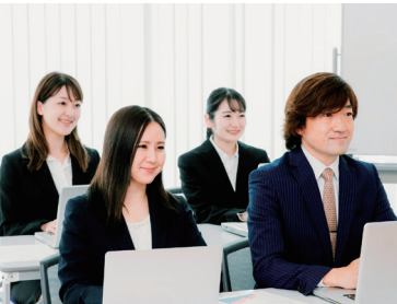
各種制度の講座・説明会（イメージ）