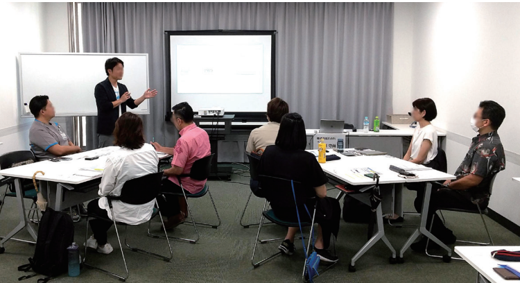
人材育成推進者養成講座