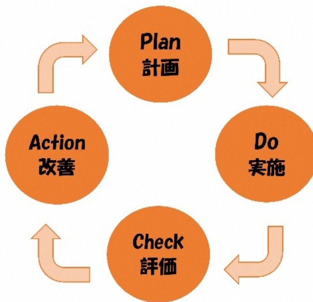
図 7-2 PDCAサイクルのイメージ

また、糸満市水産業振興協議会において、概ね5年目を目安に、施策の達成状況等の評価を行う。