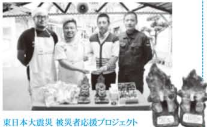
東日本大震災 被災者応援プロジェクト

南部地区青年団連絡協議会が、「東日本大震災 被災者応援プロジェクト」と題して、岩手県陸前高田市などに行き、支援金や特産品を届ける取り組みを進めています。エイサー大会などの際に募金を募り集まった161,828円のうち、現地の若者が取り組む「桜ライン311」に125,000円を、そのほか、シーサーやお菓子などの特産品を購入して被災者へ届けることになりました。