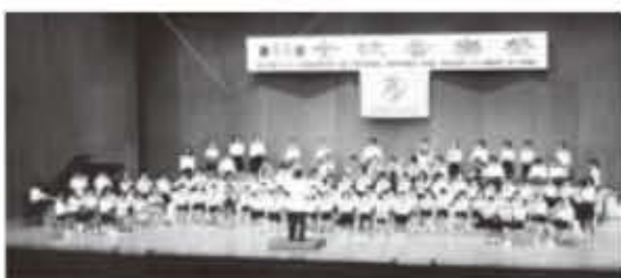
【器楽合奏】兼城小学校4年

兼 兼城小学校の4年生が、全沖縄学校音楽発表会を経て、1月に開催された「全琉音楽祭」に島尻地区から唯一出演しました。