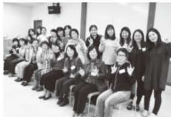
手話奉仕員養成講座(入門編I)閉講式

2月19日、平成25年度「手話奉仕員養成講座(入門編I)」の閉講式が中央図書館で開催されました。この講座は手話で日常会話を行うために必要な技術の習得などを目的に、去年の10月から計18回開催されています。受講生は引き続き4月から始まる「入門編II」に進み、さらに知識を深めた後、「糸満市手話奉仕員」として登録される予定です。