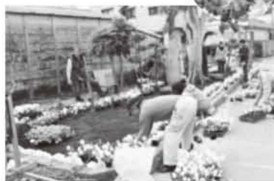
西区・町端区 花いっぱいフェア

2月16日、「西区・町端区 花いっぱいフェア」と題して、地域住民が参加して道路沿いに約1,500鉢の花の苗を植え付けました。この取り組みは、沖縄県風景づくり推進事業の一環として、まちの美しい風景を守り育てることを目的に行われています。インパチェンスやマリーゴールド、ペチュニアなど色とりどりの花が花壇を彩り、道行く人たちが足を止めて花を眺めていました。