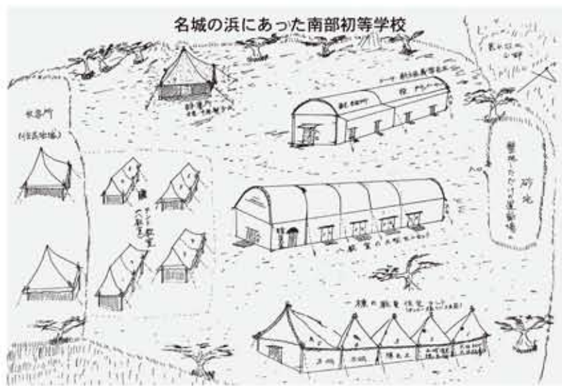
『真壁小学校創立百周年の歩み』より

摩文仁村民の疎開指定地は恩納村名嘉真であった。役場からの勧めに応じて最初に疎開した人々は、トラックで名嘉真に向かった。艦砲射撃が始まった後にも、人々は馬車や徒歩で名嘉真に向かっている。摩文仁村出身者の山原疎開者は190人で、うち66人が大度出身者であった。