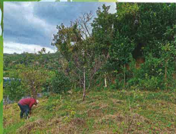
森林整備事業（名護市）