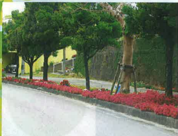
地域緑化活動（八重瀬町）