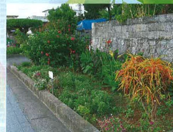
地域緑化活動（糸満市）